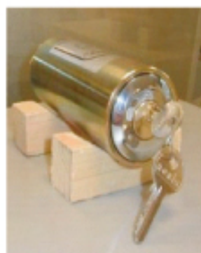
Cylindre 60 K

Trépan : fourni pour les petits modèles (avec supplément)