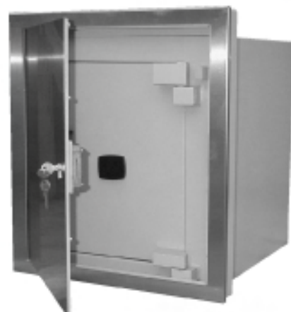
DS 306 TF Portillon Inox